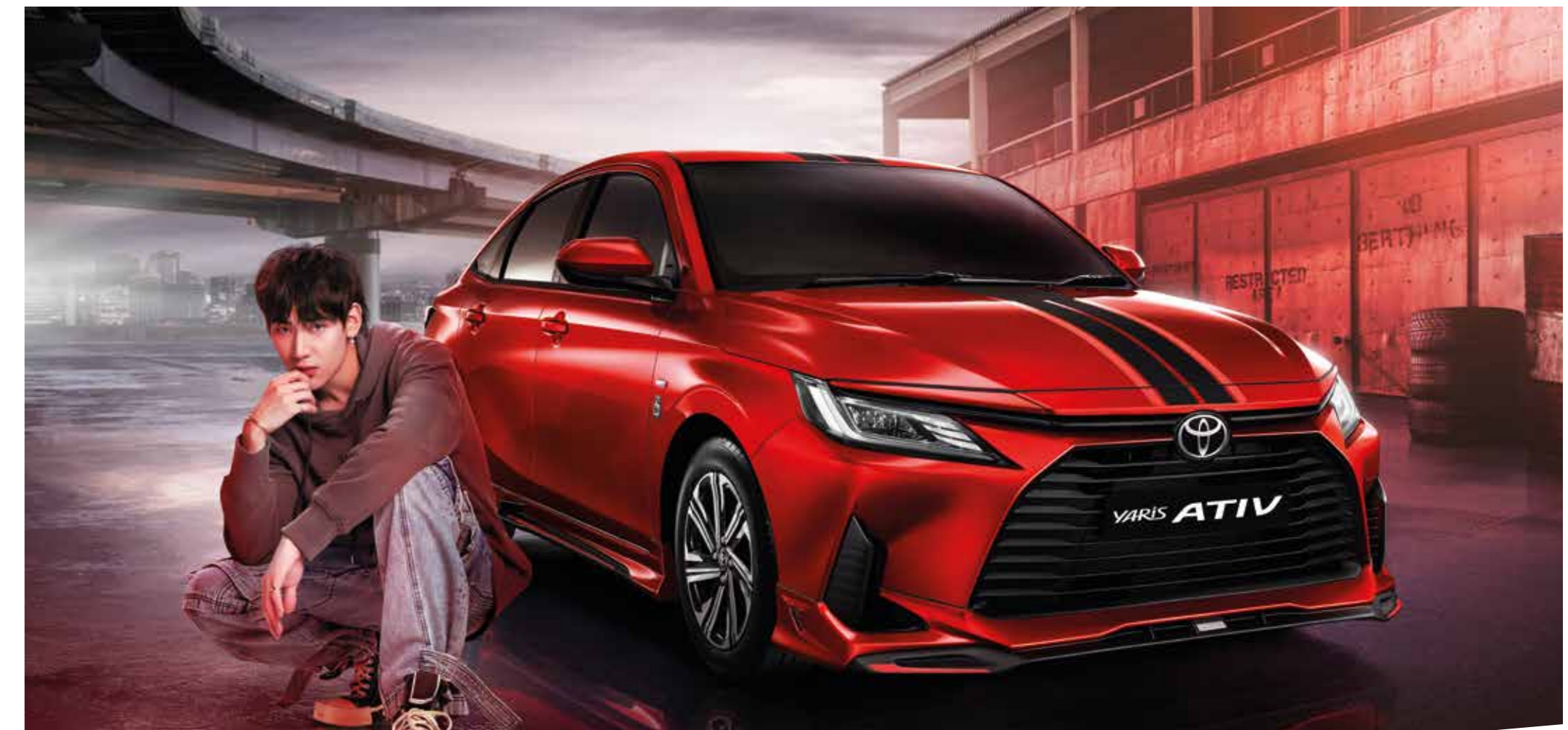
1. ชุดสติกเกอร์ 2. สทึร์ดกับนชนหน้า 3. ชุดสทึร์ดขัง 4. สทึร์ดกับนชนหลัง 5. สปอยเลอร์หลัง