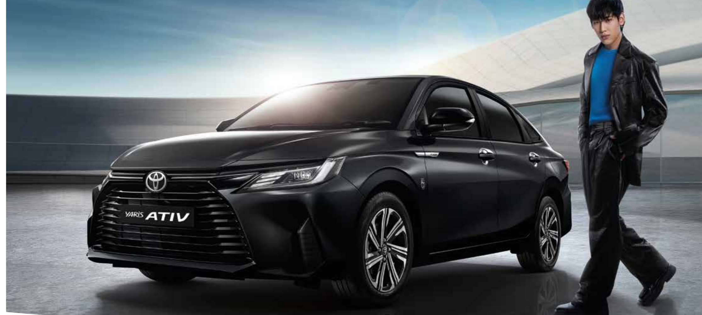
1. คิ้วกระจังหน้า 2. คิ้วดกทังซุ้มล้อ 3. ชุดครอบทังจับประตูโครเมียม 4. คิ้วดกทังแต่งฝาท้าย